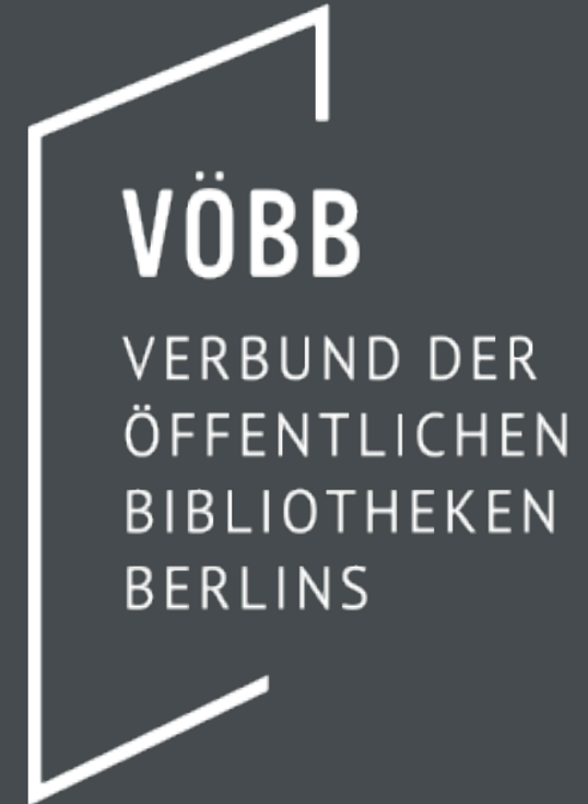
VÖBB + Genios